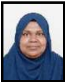
Հանրապետության Գործադիր կառավարման կոմիտեի (Գ. Գրքերի, հրատարակչության)