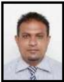
Հանրապետության Գործադիր կառավարման կոմիտեի (Գ. Գրքերի, հրատարակչության)