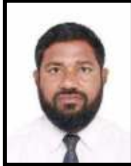
Հանրապետության Գործադիր կառավարման կոմիտեի (Գ. Գրքերի, հրատարակչության)