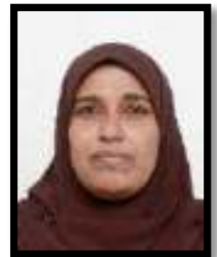
Հանրապետության Գործադիր կառավարման կոմիտեի (Գ. Գրքերի, հրատարակչության)